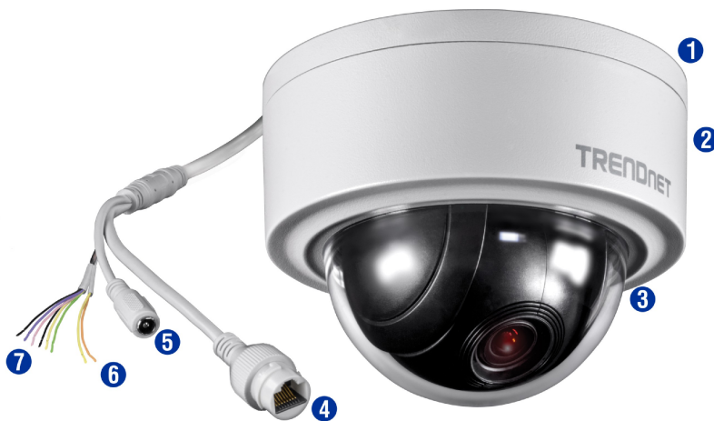
Illustration Eines Network

Entwickelt für extreme Bedingungen mit Wetterschutzklasse IP66 und Betriebstemperaturbereich von -30 – 60 °C (-22 – 140 °F).