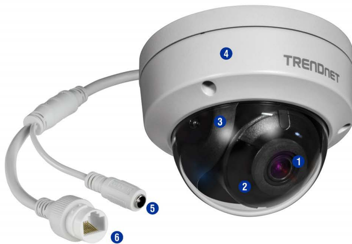
Illustration Eines Network

Geeignet für die Verwendung im Freien mit Wetterschutzklasse IP67 und einem Betriebstemperaturbereich von -30° – 60°C (-22° – 140°F).