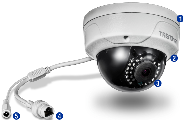
Illustration Eines Network

Für extreme Bedingungen mit Wetterschutzklasse IP66 und breitem Betriebstemperaturbereich von -30 – 60 °C (-22 – 140 °F).