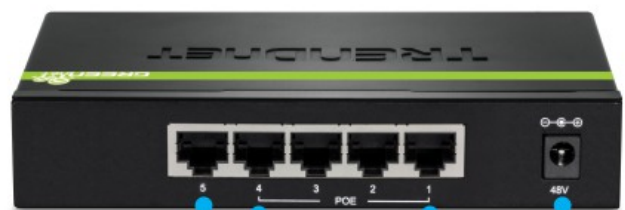
1 x porta Gigabit 4 Portas Gigabit PoE+ Alimentação