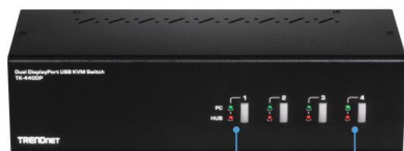
Botões no painel frontal