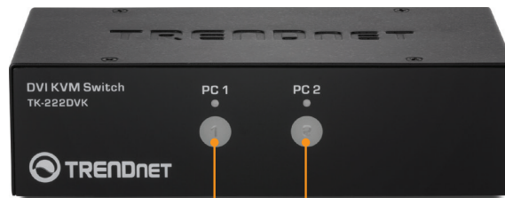
Botones del selector de la PC