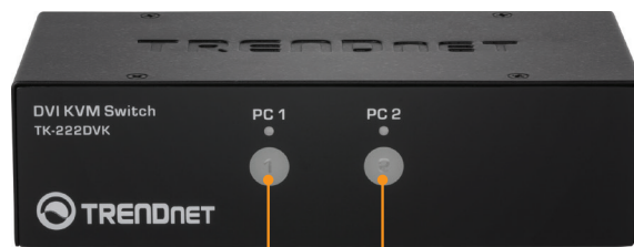
Bottoni del selezionatore del PC