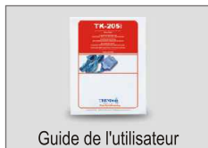
Guide de l'utilisateur

Le Switch KVM TK-205i à 2 ports est compatible avec pratiquement tous les ordinateurs et les systèmes d'exploitation. Vous n'avez besoin que d'un moniteur, d'un clavier PS/2 et d'une souris PS/2.