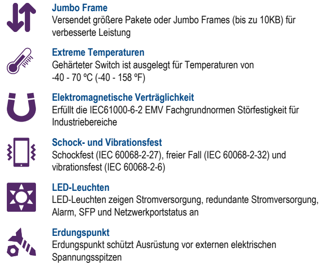
Illustration Eines Network