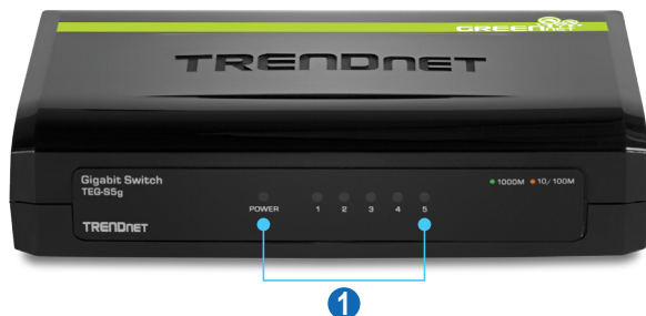
1 Esposizione di LED