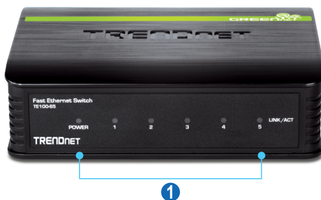
Illustration eines netzwerks

Stromsparende GREENnet-Technologie reduziert den Stromverbrauch um bis zu 40%