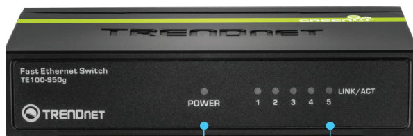
Illustration Eines Netzwerks

Stromsparende GREENnet-Technologie reduziert den Stromverbrauch um bis zu 40%