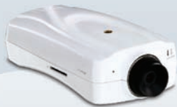
ProView PoE-Internetkamera TV-IP512P

Rund um die Uhr aktives Überwachungssystem mit Bewegungserkennung aus 15 über einen PoE Web-Smart-Switch vernetzten PoE-Internetkameras von TRENDnet.