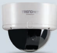
Drahtlose SecurView PoE-Dome-Internetkamera TV-IP252P