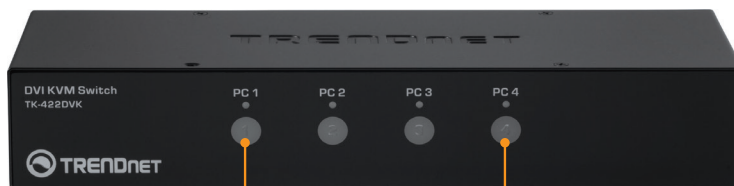
Botões do selector do PC