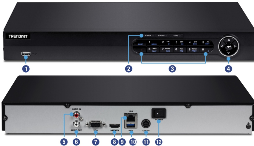
Illustration Eines Network

Benutzer erleben die Verwaltungsoberfläche als intuitiv und einfach zu verwenden – schnelle Navigation von Liveansichtseinstellungen, Aufzeichnungsplänen und fortschrittliche Wiedergabeoptionen.