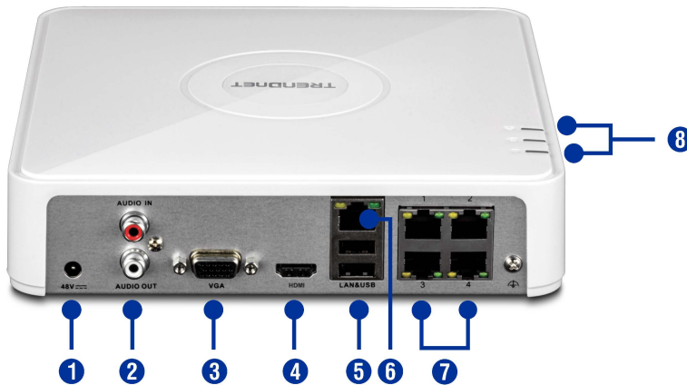
Illustration Eines Network

Benutzer finden die Verwaltungsoberfläche intuitiv und einfach zu verwenden – Sie können leicht zwischen Liveansichtspräferenzen, Aufzeichnungsplänen und fortgeschrittenen Wiedergabeoptionen wechseln.