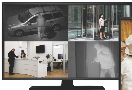
Просмотр в четырех окнах

Пользователи оценят интуитивно понятный и простой в использовании интерфейс управления - быструю навигацию, запись по расписанию и продвинутые настройки воспроизведения.