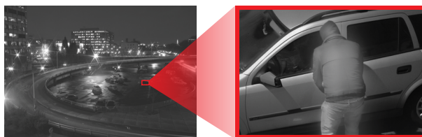
20x optical zoom, 16x digital zoom, and autofocus