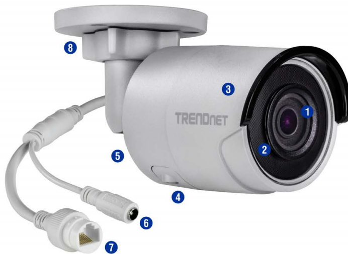
Illustration Eines Network

Geeignet für die Verwendung im Freien mit Wetterschutzklasse IP67 und einem Betriebstemperaturbereich von -30° – 60°C (-22° – 140°F).