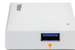
USB 3.0 Port