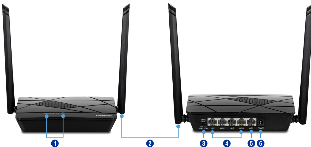
Illustration Eines Network

Kontrollieren Sie Internetzugang und verwalten Sie Bandbreitennutzung von Geräten, die mit dem Router verbunden sind