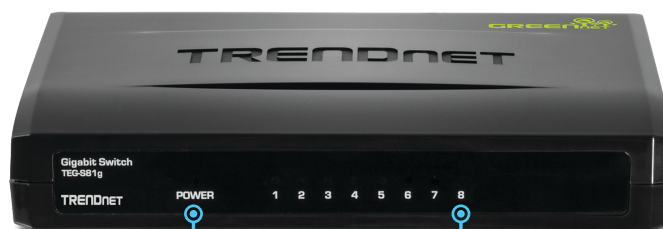
LED de diagnóstico